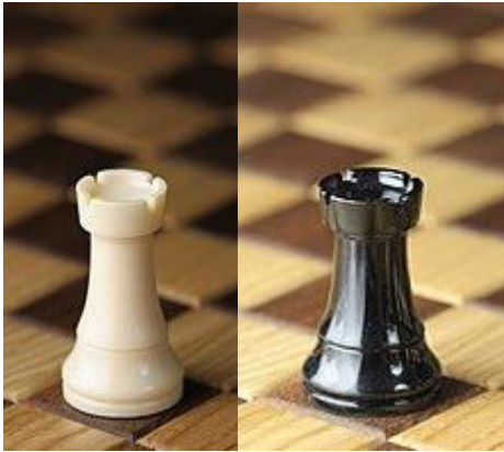
Turn alb turn negru

Turnul este una din piesele folosite la sah . Se mai numește și tură . Fiecare jucător are la începutul jocului două turnuri, așezate în colțurile tablei. În notație algebrică, turnurile albului sunt așezate pe a1 și h1, iar cele ale negrului pe a8 și h8.